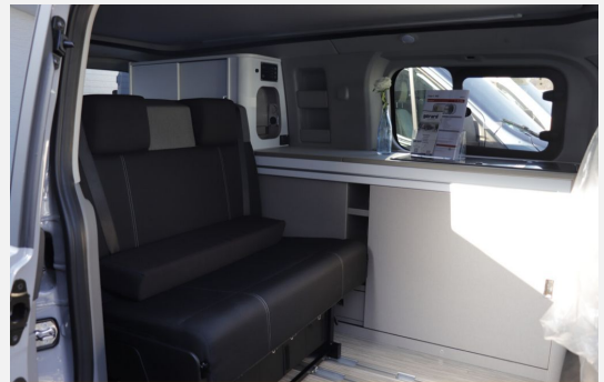
gérard Caravaning 08803 / 63 64-0 info@wohnwagen-gerard.de KNAUS WEINBERG INTER CARAVANNING RENT-OF-TRAVEL FENDT CARAVAN