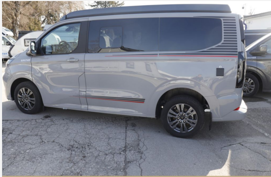
gérard Caravaning 08803 / 63 64-0 info@wohnwagen-gerard.de KNAUS WEINBERG INTER CARAVANNING RENT-OF-TRAVEL FENDT CARAVAN