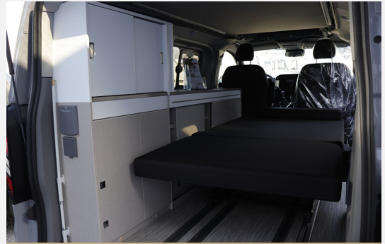
gérard Caravaning 08803 / 63 64-0 info@wohnwagen-gerard.de KNAUS WEINBERG INTER CARAVANNING RENT-OF-TRAVEL FENDT CARAVAN