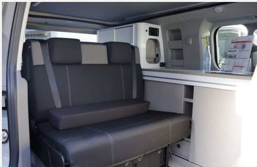
gérard Caravaning 08803 / 63 64-0 info@wohnwagen-gerard.de KNAUS WEINBERG INTER CARAVANNING RENT-OF-TRAVEL FENDT CARAVAN