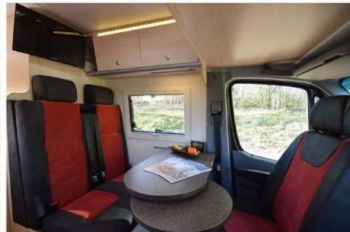
MERCEDES BENZ SPRINTER BRESLER 591 DF