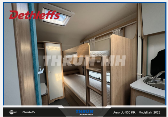
THRUN CARAVAN-PARK Aero Up 530 KR, Modelljahr 2023