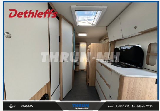
THRUN CARAVAN-PARK Aero Up 530 KR, Modelljahr 2023