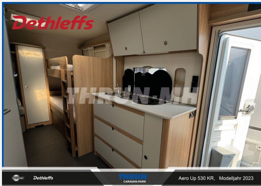
THRUN CARAVAN-PARK Aero Up 530 KR, Modelljahr 2023