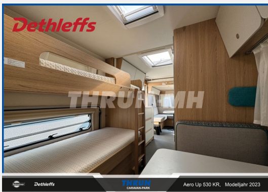
THRUN CARAVAN-PARK Aero Up 530 KR, Modelljahr 2023