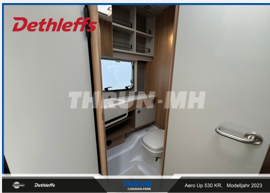
THRUN CARAVAN-PARK Aero Up 530 KR, Modelljahr 2023