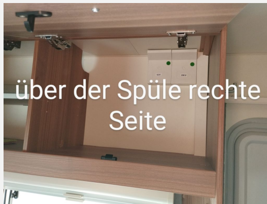
über der Spüle rechte Seite