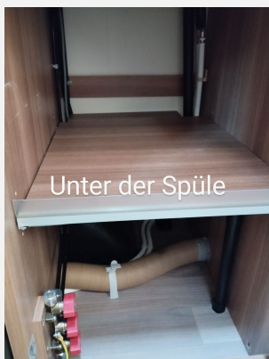
Unter der Spüle