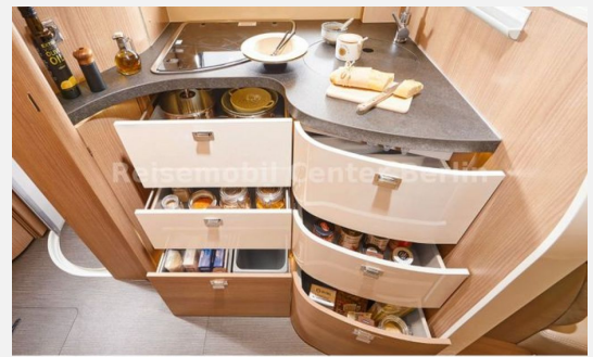
Reisemobil Center M&M Berlin