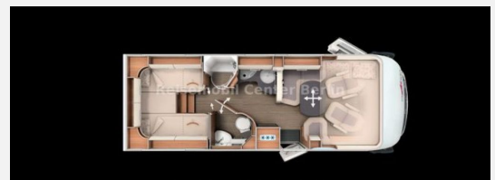
Reisemobil Center M&M Berlin