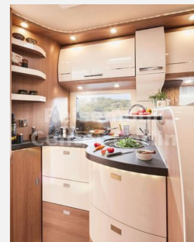
Reisemobil Center M&M Berlin