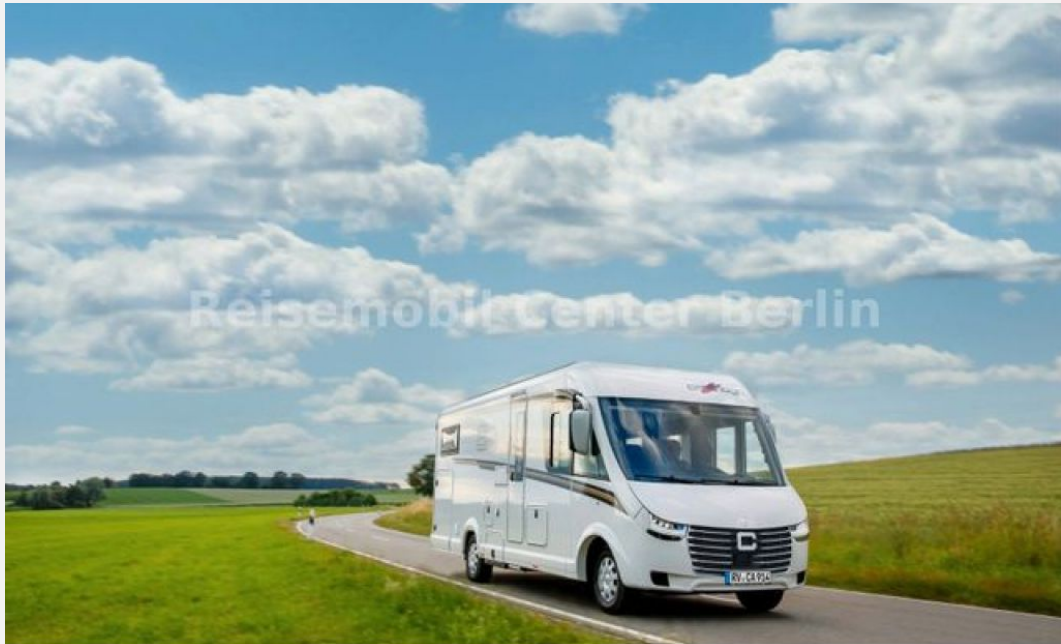
Reisemobil Center M&M Berlin