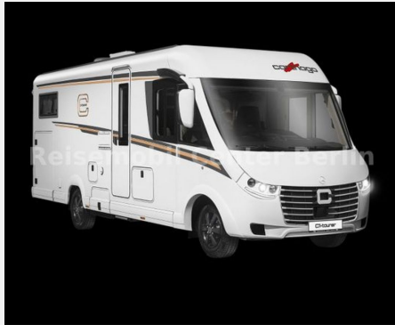
Reisemobil Center M&M Berlin