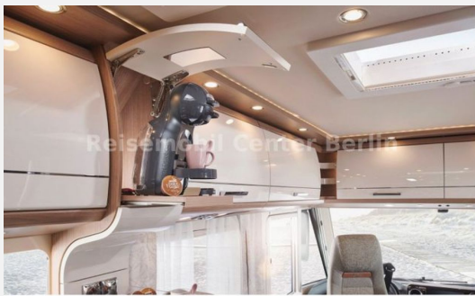
Reisemobil Center M&M Berlin