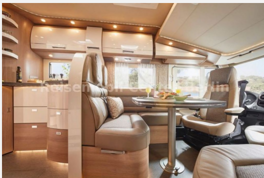
Reisemobil Center M&M Berlin