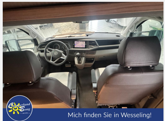
Mich finden Sie in Wesseling!