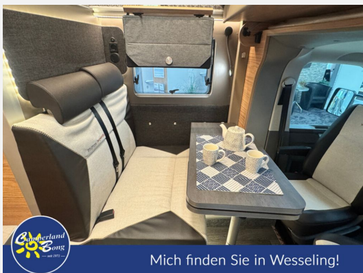
Mich finden Sie in Wesseling!