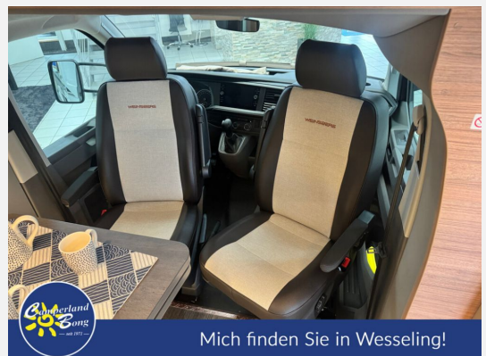
Mich finden Sie in Wesseling!