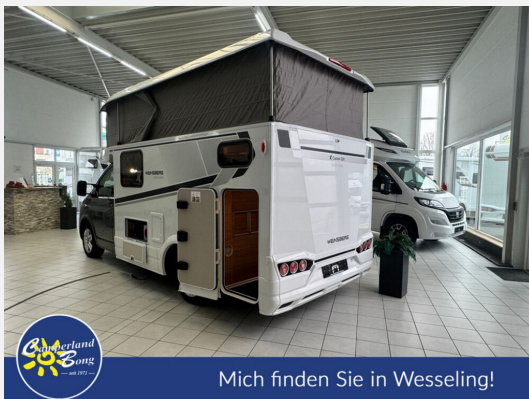
Mich finden Sie in Wesseling!