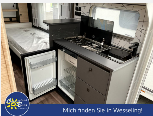
Mich finden Sie in Wesseling!