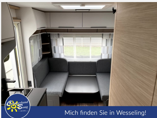
Mich finden Sie in Wesseling!