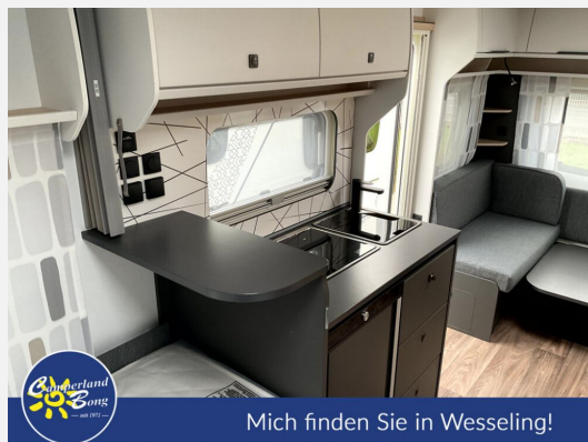
Mich finden Sie in Wesseling!