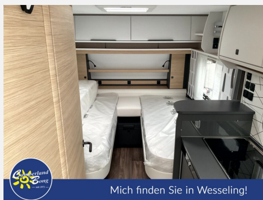
Mich finden Sie in Wesseling!