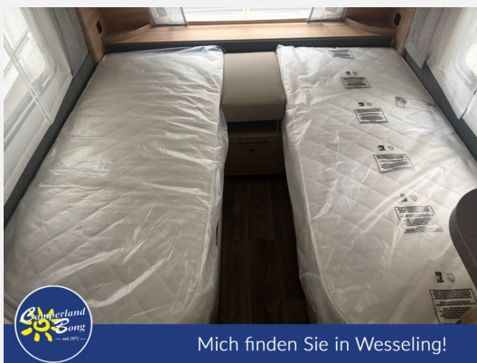
Mich finden Sie in Wesseling!