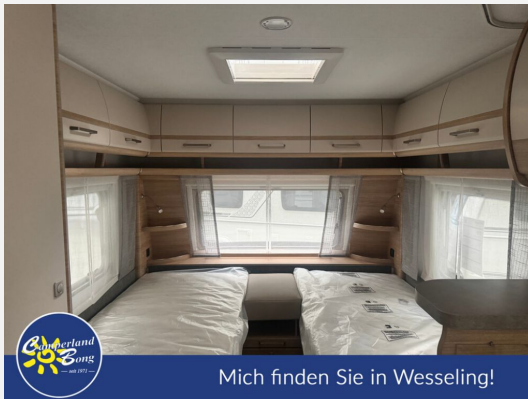
Mich finden Sie in Wesseling!