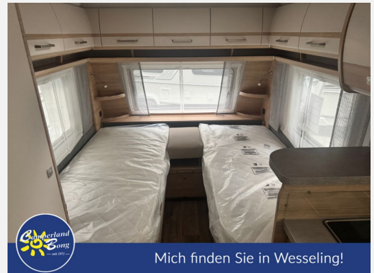
Mich finden Sie in Wesseling!