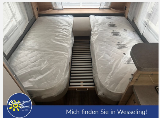
Mich finden Sie in Wesseling!