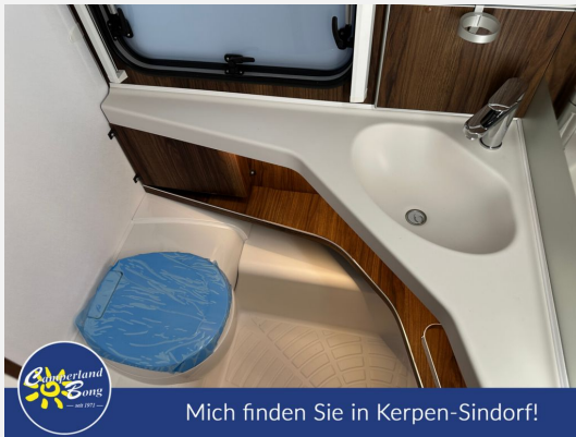
Mich finden Sie in Kerpen-Sindorf!