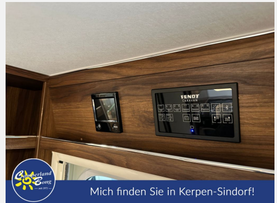
Mich finden Sie in Kerpen-Sindorf!