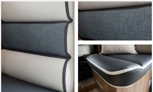
MACARON - Kunstleder (optional)