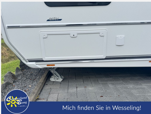
Mich finden Sie in Wesseling!