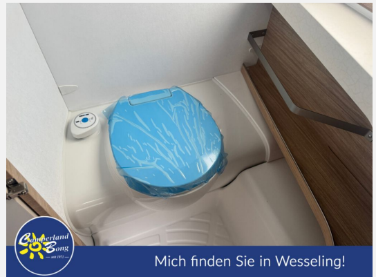
Mich finden Sie in Wesseling!