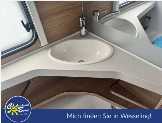
Mich finden Sie in Wesseling!