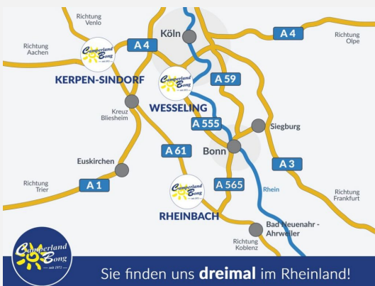
Sie finden uns dreimal im Rheinland!