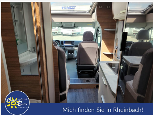
Mich finden Sie in Rheinbach!