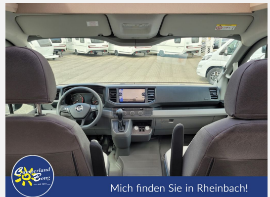
Mich finden Sie in Rheinbach!