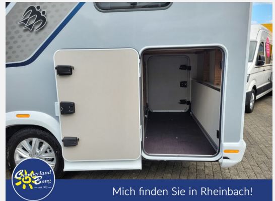
Mich finden Sie in Rheinbach!