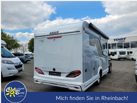
Mich finden Sie in Rheinbach!