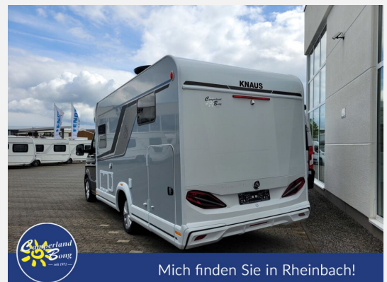
Mich finden Sie in Rheinbach!