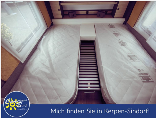
Mich finden Sie in Kerpen-Sindorf!