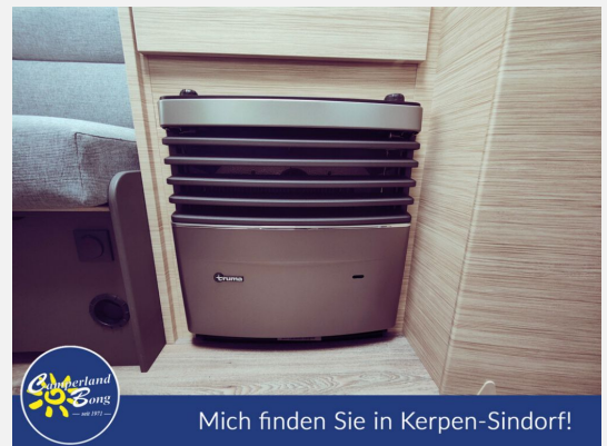
Mich finden Sie in Kerpen-Sindorf!