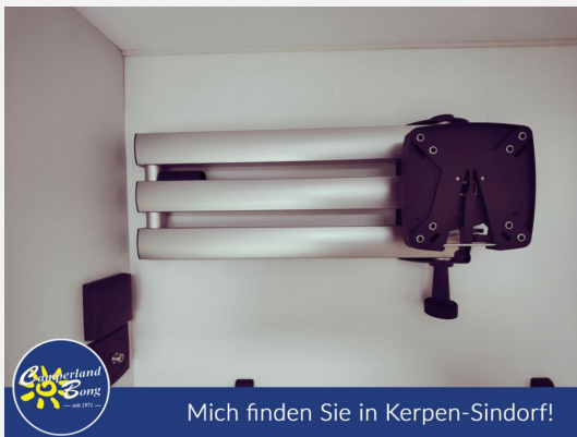
Mich finden Sie in Kerpen-Sindorf!