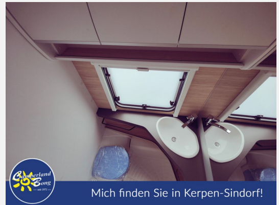
Mich finden Sie in Kerpen-Sindorf!