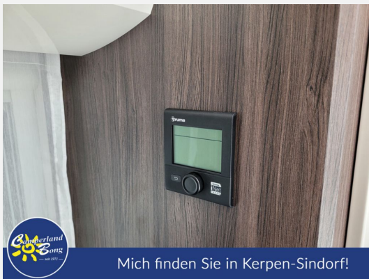
Mich finden Sie in Kerpen-Sindorf!