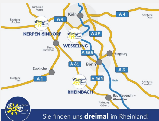
Sie finden uns dreimal im Rheinland!