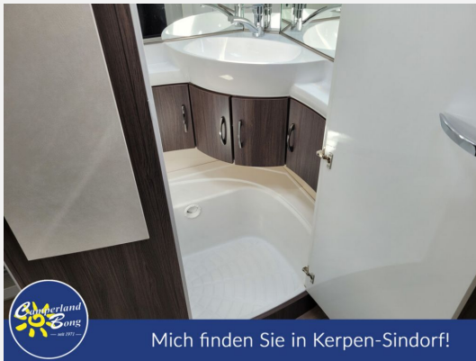
Mich finden Sie in Kerpen-Sindorf!