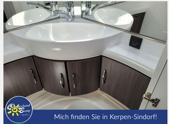
Mich finden Sie in Kerpen-Sindorf!