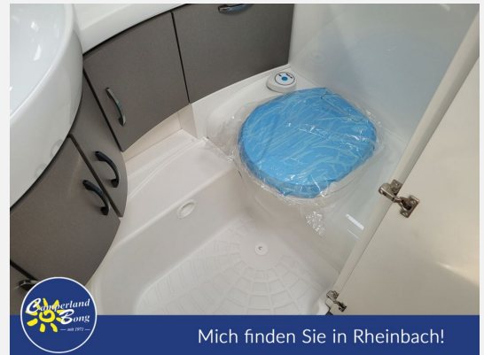
Mich finden Sie in Rheinbach!