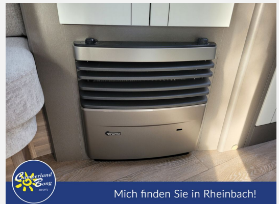
Mich finden Sie in Rheinbach!