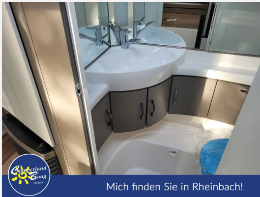
Mich finden Sie in Rheinbach!