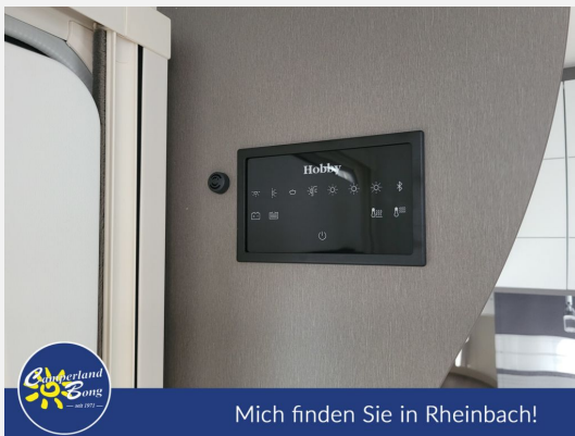
Mich finden Sie in Rheinbach!