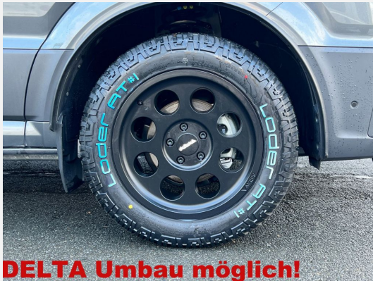
DELTA Umbau möglich!