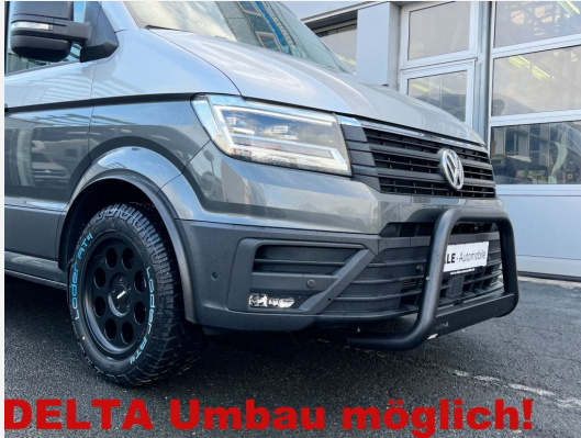
DELTA Umbau möglich!