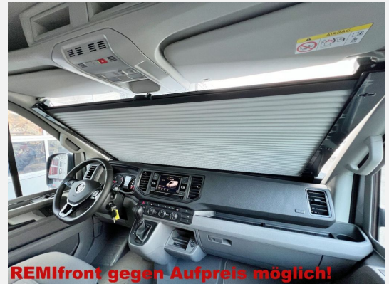
REMIfront gegen Aufpreis möglich!