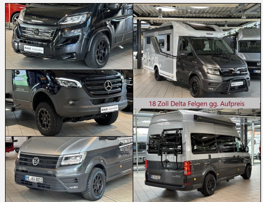
18 Zoll Delta Felgen gg. Aufpreis