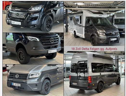
18 Zoll Delta Felgen gg. Aufpreis