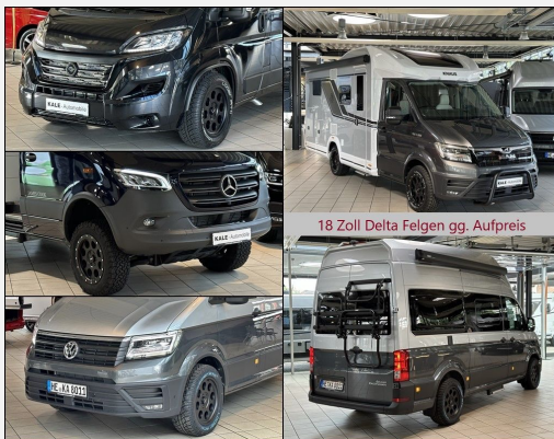
18 Zoll Delta Felgen gg. Aufpreis

Offizieller Vertragshändler für: EHYMER carado KNAUS LMC TABBERT ERIBA ADAC Wohnmobilvermittlung