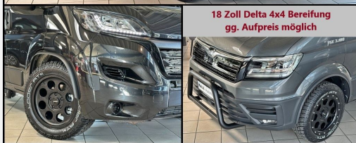
18 Zoll Delta 4x4 Bereifung gg. Aufpreis möglich