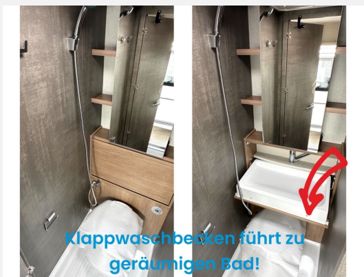
Klappwaschbecken führt zu geräumigen Bad!