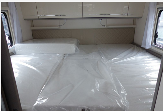
Camper NRW by Hartmann GmbH – Verkauf, Vermietung und Service von Reisemobilen Alfred-Nebel-Str. 7 | 41515 Grevenbroich | Tel.: 021 81 / 65 56-10 00 | anfrage@camper-nrw.de | www.camper-nrw.de CAMPER NRW