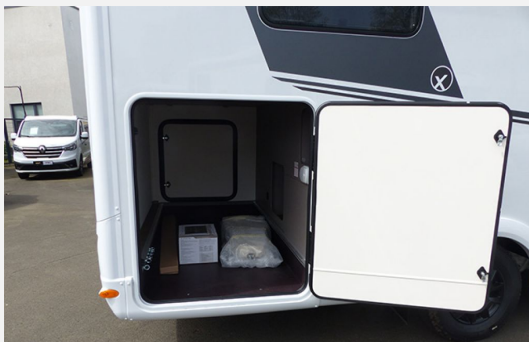
Camper NRW by Hartmann GmbH – Verkauf, Vermietung und Service von Reisemobilen Alfred-Nobel-Str. 7 | 41515 Grevenbroich | Tel.: 021 81 / 65 86-10 88 | anfrage@camper-nrw.de | www.camper-nrw.de