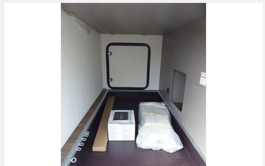
Camper NRW by Hartmann GmbH – Verkauf, Vermietung und Service von Reisemobilen Alfred-Nobel-Str. 7 | 41515 Grevenbroich | Tel.: 021 81 / 65 86-10 88 | anfrage@camper-nrw.de | www.camper-nrw.de