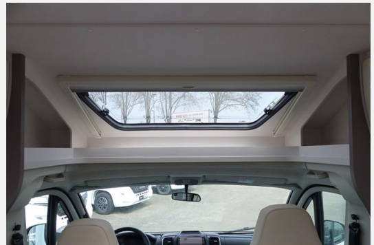
Camper NRW by Hartmann GmbH – Verkauf, Vermietung und Service von Reisemobilen Alfred-Nobel-Str. 7 | 41515 Grevenbroich | Tel.: 021 81 / 65 86-10 88 | anfrage@camper-nrw.de | www.camper-nrw.de