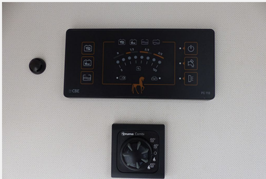
Camper NRW by Hartmann GmbH – Verkauf, Vermietung und Service von Reisemobilen Alfred-Nobel-Str. 7 | 41515 Grevenbroich | Tel.: 021 81 / 65 86-10 88 | anfrage@camper-nrw.de | www.camper-nrw.de