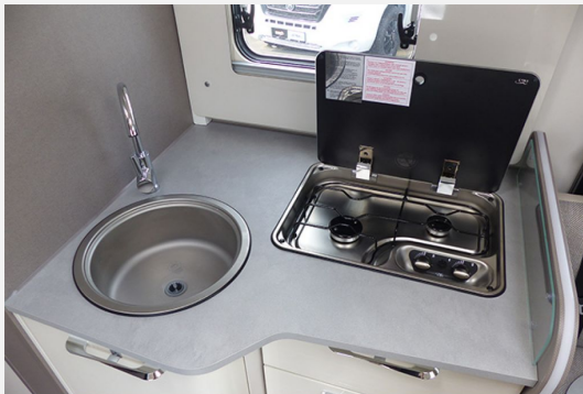
Camper NRW by Hartmann GmbH – Verkauf, Vermietung und Service von Reisemobilen Alfred-Nebel-Str. 7 | 41515 Grevenbroich | Tel.: 021 81 / 65 56-10 00 | anfrage@camper-nrw.de | www.camper-nrw.de CAMPER NRW