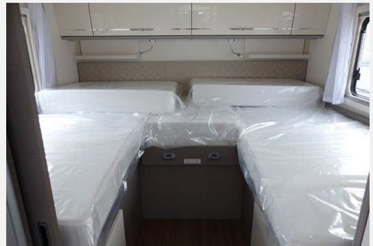
Camper NRW by Hartmann GmbH – Verkauf, Vermietung und Service von Reisemobilen Alfred-Nebel-Str. 7 | 41515 Grevenbroich | Tel.: 021 81 / 65 56-10 00 | anfrage@camper-nrw.de | www.camper-nrw.de CAMPER NRW