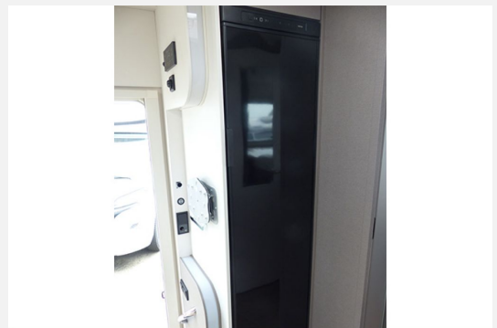
Camper NRW by Hartmann GmbH – Verkauf, Vermietung und Service von Reisemobilen Alfred-Nebel-Str. 7 | 41515 Grevenbroich | Tel.: 021 81 / 65 56-10 00 | anfrage@camper-nrw.de | www.camper-nrw.de CAMPER NRW