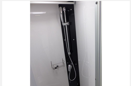
Camper NRW by Hartmann GmbH – Verkauf, Vermietung und Service von Reisemobilen Alfred-Nebel-Str. 7 | 41515 Grevenbroich | Tel.: 021 81 / 65 56-10 00 | anfrage@camper-nrw.de | www.camper-nrw.de CAMPER NRW