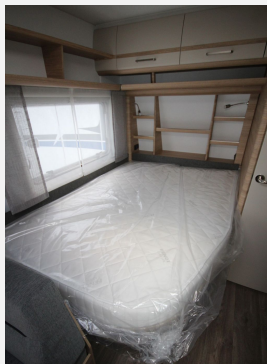
CAMPER BASE Rhein-Main FENDT CARAVAN Hobby KNAUS T@B WEINSBERG