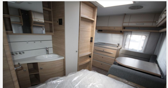
CAMPER BASE Rhein-Main FENDT CARAVAN Hobby KNAUS T@B WEINSBERG