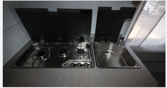
CAMPER BASE Rhein-Main FENDT CARAVAN Hobby KNAUS T@B WEINSBERG