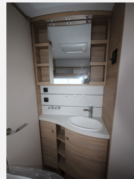
CAMPER BASE Rhein-Main FENDT CARAVAN Hobby KNAUS T@B WEINSBERG