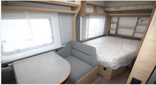
CAMPER BASE Rhein-Main FENDT CARAVAN Hobby KNAUS T@B WEINSBERG