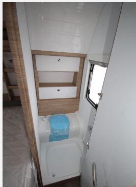
CAMPER BASE Rhein-Main FENDT CARAVAN Hobby KNAUS T@B WEINSBERG