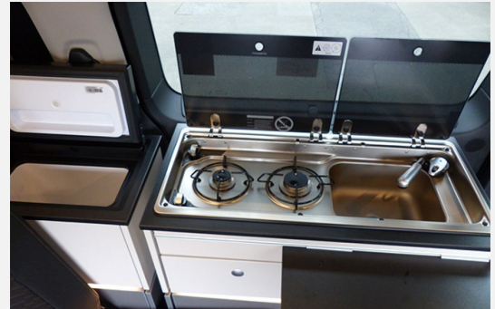
Camper NRW by Hartmann GmbH – Verkauf, Vermietung und Service von Reisemobilen Alfred-Nobel-Str. 7 | 41515 Grevenbroich | Tel.: 021 81 / 65 86-10 88 | anfrage@camper-nrw.de | www.camper-nrw.de