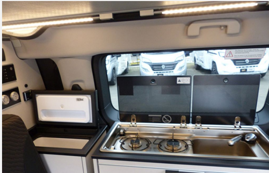
Camper NRW by Hartmann GmbH – Verkauf, Vermietung und Service von Reisemobilen Alfred-Nobel-Str. 7 | 41515 Grevenbroich | Tel.: 021 81 / 65 86-10 88 | anfrage@camper-nrw.de | www.camper-nrw.de