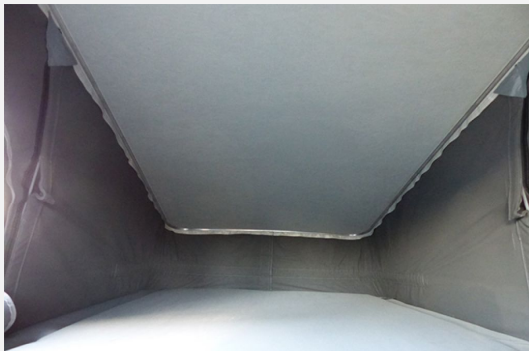
Camper NRW by Hartmann GmbH – Verkauf, Vermietung und Service von Reisemobilen Alfred-Nobel-Str. 7 | 41515 Grevenbroich | Tel.: 021 81 / 65 86-10 88 | anfrage@camper-nrw.de | www.camper-nrw.de