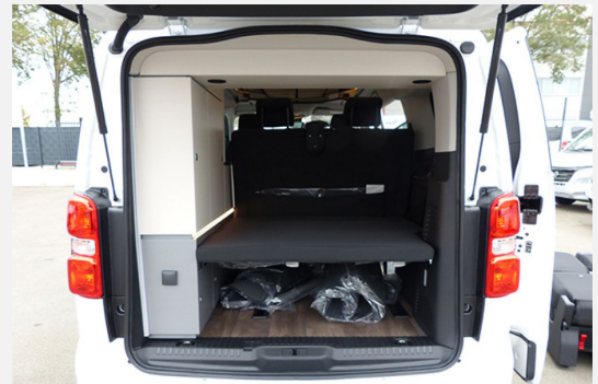
Camper NRW by Hartmann GmbH – Verkauf, Vermietung und Service von Reisemobilen Alfred-Nobel-Str. 7 | 41515 Grevenbroich | Tel.: 021 81 / 65 86-10 88 | anfrage@camper-nrw.de | www.camper-nrw.de