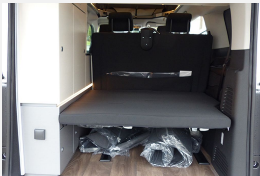
Camper NRW by Hartmann GmbH – Verkauf, Vermietung und Service von Reisemobilen Alfred-Nobel-Str. 7 | 41515 Grevenbroich | Tel.: 021 81 / 65 86-10 88 | anfrage@camper-nrw.de | www.camper-nrw.de