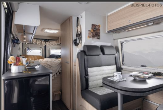
Cliff Innenraum Ansicht / Ambiente