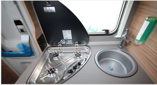
CAMPER BASE Rhein-Main FENDT CAROLANN Hobby KNAUS T@B WEINBERG