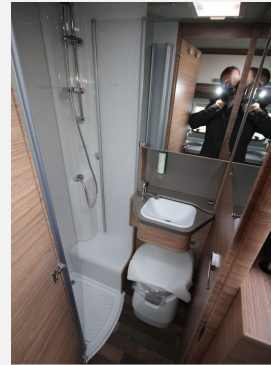
CAMPER BASE Rhein-Main FENDT CAROLANN Hobby KNAUS T@B WEINBERG