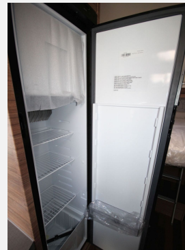
CAMPER BASE Rhein-Main FENDT CAROLANN Hobby KNAUS T@B WEINBERG