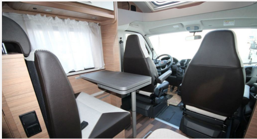
CAMPER BASE Rhein-Main FENDT CAROLANN Hobby KNAUS T@B WEINBERG