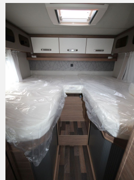
CAMPER BASE Rhein-Main FENDT CAROLANN Hobby KNAUS T@B WEINBERG