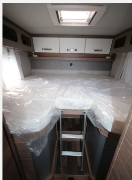
CAMPER BASE Rhein-Main FENDT CAROLANN Hobby KNAUS T@B WEINBERG