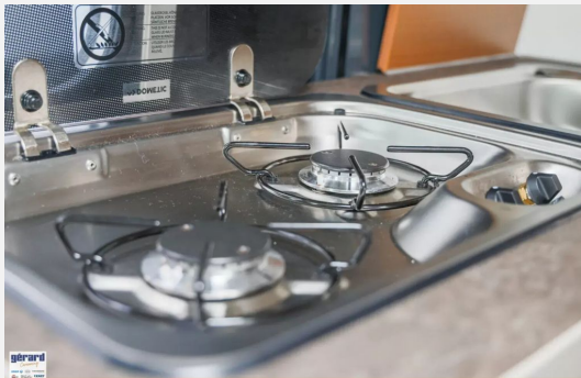
gérard Caravaning 08803 / 63 64-0 info@wohnen-gerard.de KNAUS WEINSBERG INTER CARAVANNING RENT-2-TRAVEL FENDT CARAVAN