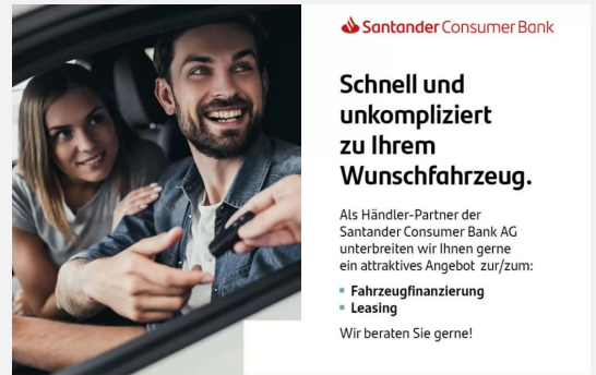
gérard Caravaning 08803 / 63 64-0 info@wohnwagen-gerard.de KNAUS WEINBERG RENT OF TRAVEL FENDT CARAVAN