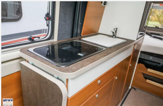
gérard Caravaning 08803 / 63 64-0 info@wohnen-gerard.de KNAUS WEINSBERG INTER CARAVANNING RENT-2-TRAVEL FENDT CARAVAN