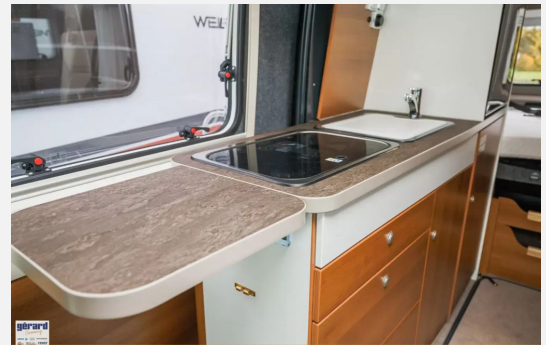
gérard Caravaning 08803 / 63 64-0 info@wohnen-gerard.de KNAUS WEINSBERG INTER CARAVANNING RENT-2-TRAVEL FENDT CARAVAN