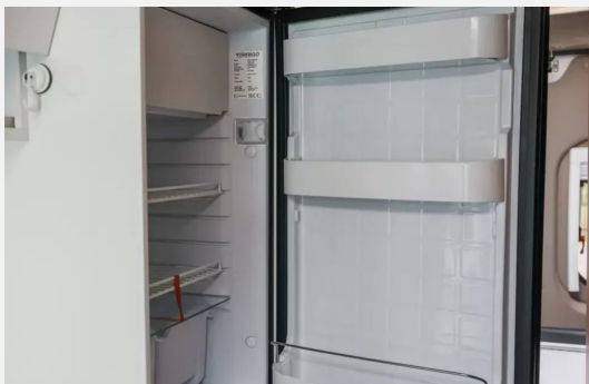
gérard Caravaning 08803 / 63 64-0 info@wohnen-gerard.de KNAUS WEINSBERG INTER CARAVANNING RENT-2-TRAVEL FENDT CARAVAN