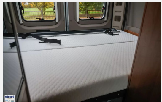
gérard Caravaning 08803 / 63 64-0 info@wohnen-gerard.de KNAUS WEINSBERG INTER CARAVANNING RENT-2-TRAVEL FENDT CARAVAN