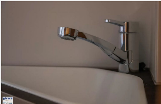
gérard Caravaning 08803 / 63 64-0 info@wohnwagen-gerard.de KNAUS WEINBERG RENT OF TRAVEL FENDT CARAVAN