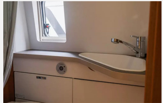
gérard Caravaning 08803 / 63 64-0 info@wohnwagen-gerard.de KNAUS WEINBERG RENT OF TRAVEL FENDT CARAVAN