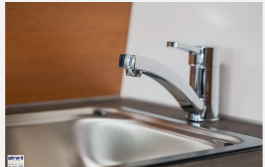
gérard Caravaning 08803 / 63 64-0 info@wohnen-gerard.de KNAUS WEINSBERG INTER CARAVANNING RENT-2-TRAVEL FENDT CARAVAN