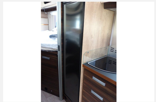
Camper NRW by Hartmann GmbH – Verkauf, Vermietung und Service von Reisemobilen Alfred-Nebel-Str. 7 | 41515 Grevenbroich | Tel.: 021 81 / 65 56-10 00 | anfrage@camper-nrw.de | www.camper-nrw.de CAMPER NRW