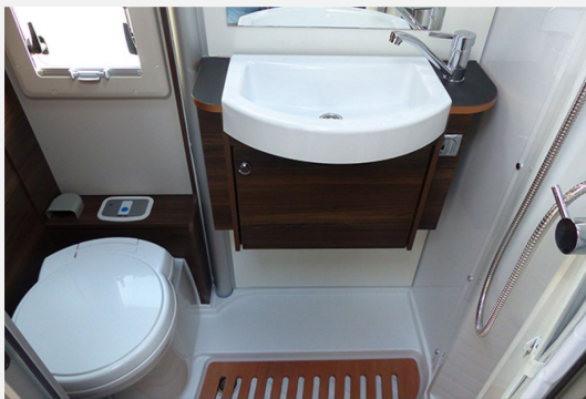
Camper NRW by Hartmann GmbH – Verkauf, Vermietung und Service von Reisemobilen Alfred-Nebel-Str. 7 | 41515 Grevenbroich | Tel.: 021 81 / 65 56-10 00 | anfrage@camper-nrw.de | www.camper-nrw.de CAMPER NRW