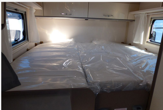
Camper NRW by Hartmann GmbH – Verkauf, Vermietung und Service von Reisemobilen Alfred-Nobel-Str. 7 | 41515 Grevenbroich | Tel.: 021 81 / 65 86-10 88 | anfrage@camper-nrw.de | www.camper-nrw.de