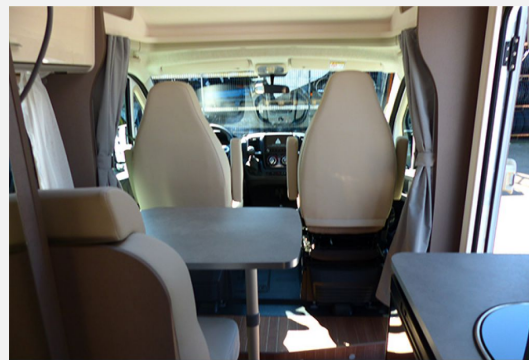
Camper NRW by Hartmann GmbH – Verkauf, Vermietung und Service von Reisemobilen Alfred-Nobel-Str. 7 | 41515 Grevenbroich | Tel.: 021 81 / 65 86-10 88 | anfrage@camper-nrw.de | www.camper-nrw.de