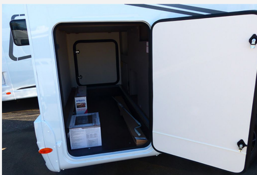
Camper NRW by Hartmann GmbH – Verkauf, Vermietung und Service von Reisemobilen Alfred-Nobel-Str. 7 | 41515 Grevenbroich | Tel.: 021 81 / 65 86-10 88 | anfrage@camper-nrw.de | www.camper-nrw.de