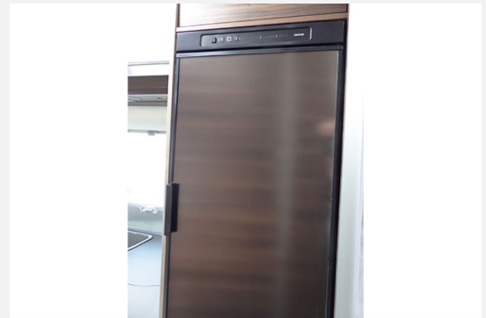
Camper NRW by Hartmann GmbH – Verkauf, Vermietung und Service von Reisemobilen Alfred-Nebel-Str. 7 | 41515 Grevenbroich | Tel.: 021 81 / 65 56-10 00 | anfrage@camper-nrw.de | www.camper-nrw.de CAMPER NRW