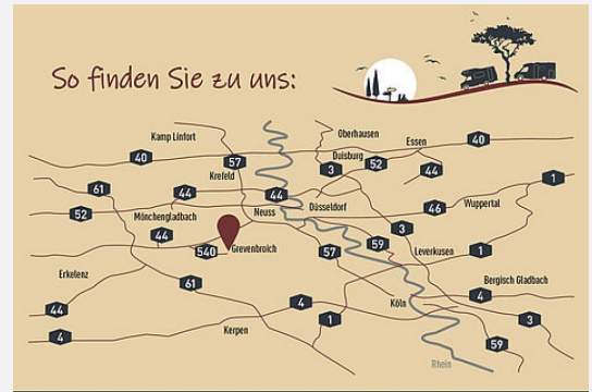
Camper NRW by Hartmann GmbH – Verkauf, Vermietung und Service von Reisemobilen Alfred-Nobel-Str. 7 | 41515 Grevenbroich | Tel.: 02181 / 65 56-10 88 | anfragen@camper-nrw.de | www.camper-nrw.de