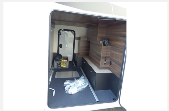
Camper NRW by Hartmann GmbH – Verkauf, Vermietung und Service von Reisemobilen Alfred-Nebel-Str. 7 | 41515 Grevenbroich | Tel.: 021 81 / 65 56-10 00 | anfrage@camper-nrw.de | www.camper-nrw.de CAMPER NRW