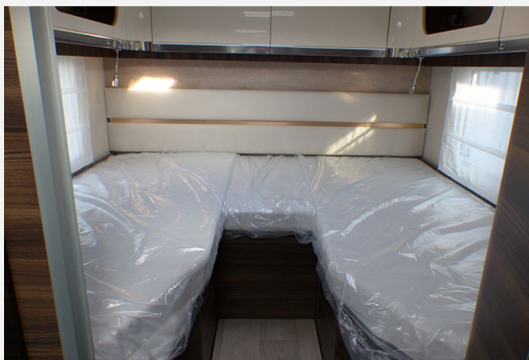
Camper NRW by Hartmann GmbH – Verkauf, Vermietung und Service von Reisemobilen Alfred-Nebel-Str. 7 | 41515 Grevenbroich | Tel.: 021 81 / 65 56-10 00 | anfrage@camper-nrw.de | www.camper-nrw.de CAMPER NRW