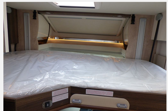
Camper NRW by Hartmann GmbH – Verkauf, Vermietung und Service von Reisemobilen Alfred-Nebel-Str. 7 | 41515 Grevenbroich | Tel.: 021 81 / 65 56-10 00 | anfrage@camper-nrw.de | www.camper-nrw.de CAMPER NRW