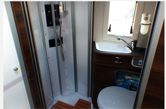
Camper NRW by Hartmann GmbH – Verkauf, Vermietung und Service von Reisemobilen Alfred-Nebel-Str. 7 | 41515 Grevenbroich | Tel.: 021 81 / 65 56-10 00 | anfragen@camper-nrw.de | www.camper-nrw.de