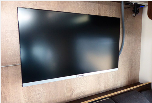
Camper NRW by Hartmann GmbH – Verkauf, Vermietung und Service von Reisemobilen Alfred-Nebel-Str. 7 | 41515 Grevenbroich | Tel.: 021 81 / 65 56-10 00 | anfragen@camper-nrw.de | www.camper-nrw.de