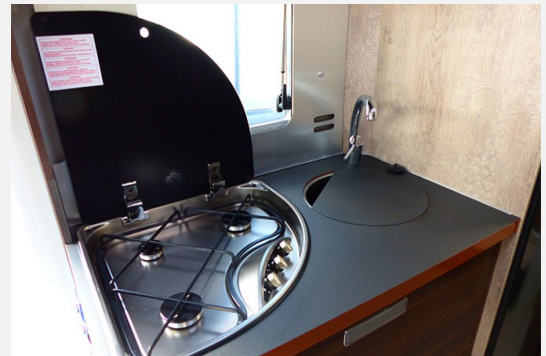
Camper NRW by Hartmann GmbH – Verkauf, Vermietung und Service von Reisemobilen Alfred-Nebel-Str. 7 | 41515 Grevenbroich | Tel.: 021 81 / 65 56-10 00 | anfragen@camper-nrw.de | www.camper-nrw.de