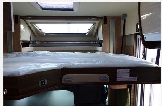
Camper NRW by Hartmann GmbH – Verkauf, Vermietung und Service von Reisemobilen Alfred-Nebel-Str. 7 | 41515 Grevenbroich | Tel.: 021 81 / 65 56-10 00 | anfragen@camper-nrw.de | www.camper-nrw.de