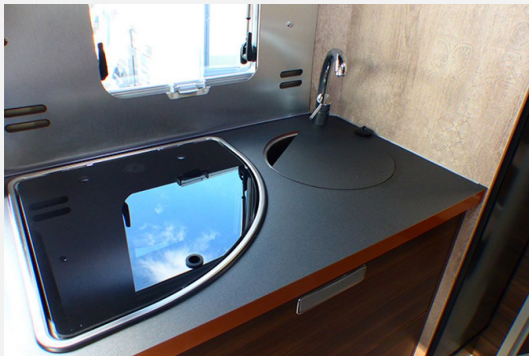
Camper NRW by Hartmann GmbH – Verkauf, Vermietung und Service von Reisemobilen Alfred-Nebel-Str. 7 | 41515 Grevenbroich | Tel.: 021 81 / 65 56-10 00 | anfragen@camper-nrw.de | www.camper-nrw.de