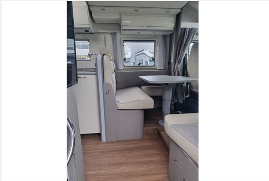
Camper NRW by Hartmann GmbH – Verkauf, Vermietung und Service von Reisemobilen Alfred-Nobel-Str. 7 | 41515 Grevenbroich | Tel.: 021 81 / 65 86-10 88 | anfrage@camper-nrw.de | www.camper-nrw.de CAMPER NRW