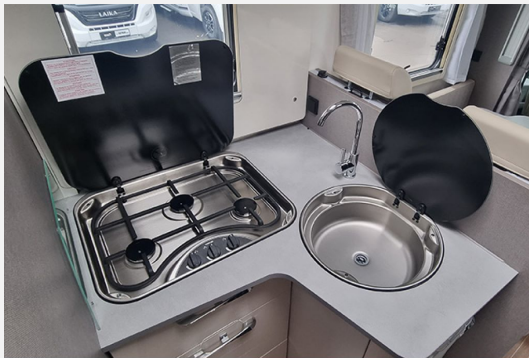
Camper NRW by Hartmann GmbH – Verkauf, Vermietung und Service von Reisemobilen Alfred-Nebel-Str. 7 | 41515 Grevenbroich | Tel.: 021 81 / 65 56-10 00 | anfrage@camper-nrw.de | www.camper-nrw.de CAMPER NRW