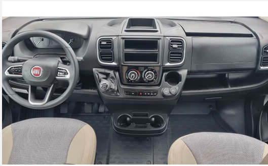
Camper NRW by Hartmann GmbH – Verkauf, Vermietung und Service von Reisemobilen Alfred-Nebel-Str. 7 | 41515 Grevenbroich | Tel.: 021 81 / 65 56-10 00 | anfrage@camper-nrw.de | www.camper-nrw.de CAMPER NRW