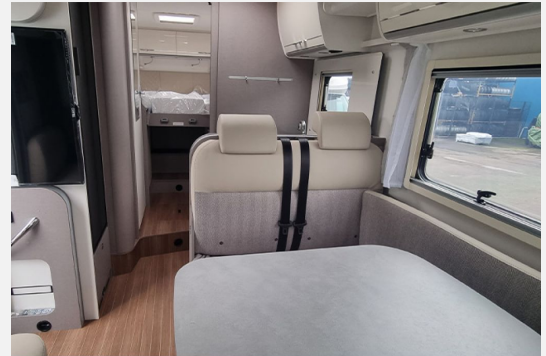
Camper NRW by Hartmann GmbH – Verkauf, Vermietung und Service von Reisemobilen Alfred-Nobel-Str. 7 | 41515 Grevenbroich | Tel.: 021 81 / 65 86-10 88 | anfrage@camper-nrw.de | www.camper-nrw.de CAMPER NRW