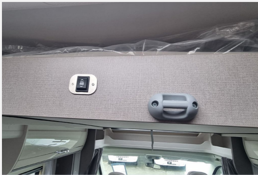
Camper NRW by Hartmann GmbH – Verkauf, Vermietung und Service von Reisemobilen Alfred-Nobel-Str. 7 | 41515 Grevenbroich | Tel.: 021 81 / 65 86-10 88 | anfrage@camper-nrw.de | www.camper-nrw.de CAMPER NRW