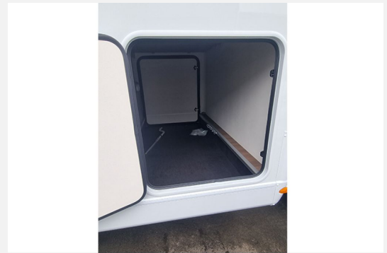
Camper NRW by Hartmann GmbH – Verkauf, Vermietung und Service von Reisemobilen Alfred-Nobel-Str. 7 | 41515 Grevenbroich | Tel.: 021 81 / 65 86-10 88 | anfrage@camper-nrw.de | www.camper-nrw.de CAMPER NRW