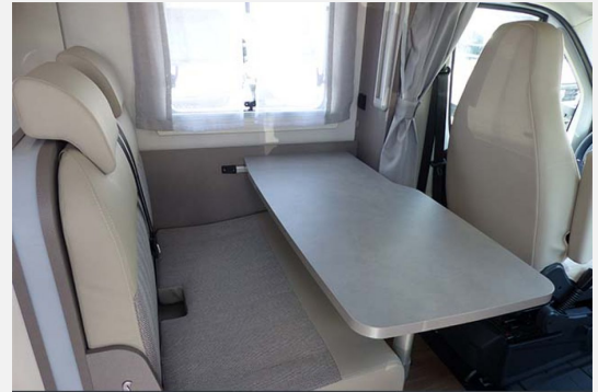
Camper NRW by Hartmann GmbH – Verkauf, Vermietung und Service von Reisemobilen Alfred-Nebel-Str. 7 | 41515 Grevenbroich | Tel.: 021 81 / 65 56-10 00 | anfrage@camper-nrw.de | www.camper-nrw.de CAMPER NRW