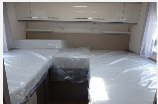
Camper NRW by Hartmann GmbH – Verkauf, Vermietung und Service von Reisemobilen Alfred-Nebel-Str. 7 | 41515 Grevenbroich | Tel.: 021 81 / 65 56-10 00 | anfrage@camper-nrw.de | www.camper-nrw.de CAMPER NRW