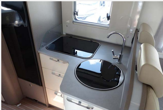
Camper NRW by Hartmann GmbH – Verkauf, Vermietung und Service von Reisemobilen Alfred-Nebel-Str. 7 | 41515 Grevenbroich | Tel.: 021 81 / 65 56-10 00 | anfrage@camper-nrw.de | www.camper-nrw.de CAMPER NRW