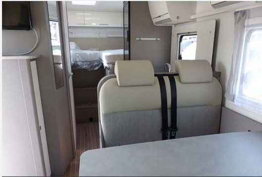
Camper NRW by Hartmann GmbH – Verkauf, Vermietung und Service von Reisemobilen Alfred-Nebel-Str. 7 | 41515 Grevenbroich | Tel.: 021 81 / 65 56-10 00 | anfrage@camper-nrw.de | www.camper-nrw.de CAMPER NRW