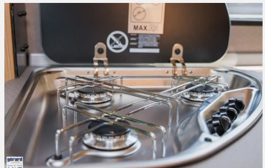
gérard Caravaning 08803 / 63 64-0 info@wohnwagen-gerard.de KNAUS WEINSBERG RENT-OF-TRAVEL FENDT CARAVAN INTER CARAVANNING