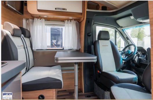
gérard Caravaning 08803 / 63 64-0 info@wohnwagen-gerard.de KNAUS WEINSBERG RENT-OF-TRAVEL FENDT CARAVAN INTER CARAVANNING