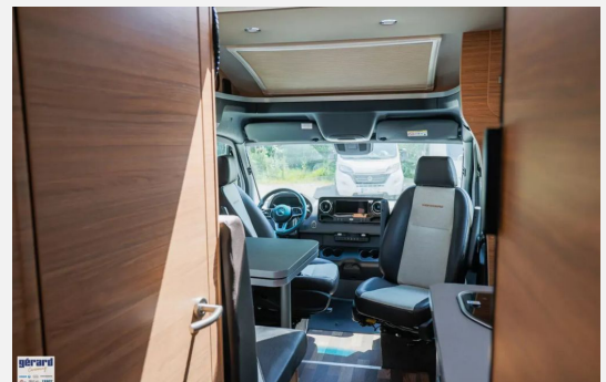
gérard Caravaning 08803 / 63 64-0 info@wohnen-gerard.de KNAUS WEINSBERG INTER CARAVANNING RENT OF TRAVEL FENDT CARAVAN