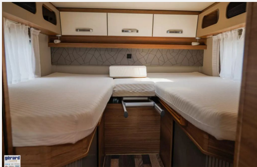
gérard Caravaning 08803 / 63 64-0 info@wohnen-gerard.de KNAUS WEINSBERG INTER CARAVANNING RENT OF TRAVEL FENDT CARAVAN