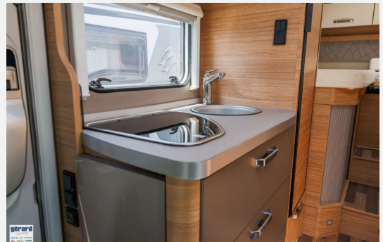
gérard Caravaning 08803 / 63 64-0 info@wohnwagen-gerard.de KNAUS WEINSBERG RENT-OF-TRAVEL FENDT CARAVAN INTER CARAVANNING