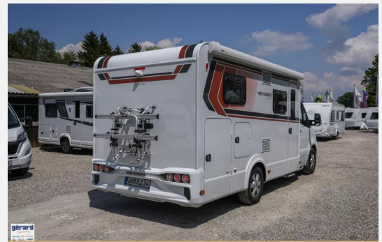
gérard Caravaning 08803 / 63 64-0 info@wohnwagen-gerard.de KNAUS WEINSBERG RENT OF TRAVEL FENDT CARAVAN INTER CARAVANNING