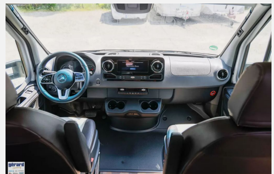
gérard Caravaning 08803 / 63 64-0 info@wohnwagen-gerard.de KNAUS WEINSBERG RENT OF TRAVEL FENDT CARAVAN INTER CARAVANNING