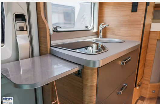
gérard Caravaning 08803 / 63 64-0 info@wohnwagen-gerard.de KNAUS WEINSBERG RENT-OF-TRAVEL FENDT CARAVAN INTER CARAVANNING