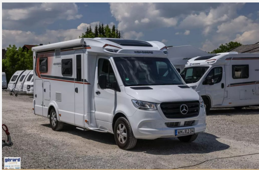
gérard Caravaning 08803 / 63 64-0 info@wohnwagen-gerard.de KNAUS WEINSBERG RENT OF TRAVEL FENDT CARAVAN INTER CARAVANNING