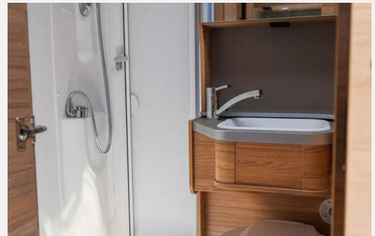
gérard Caravaning 08803 / 63 64-0 info@wohnen-gerard.de KNAUS WEINSBERG INTER CARAVANNING RENT OF TRAVEL FENDT CARAVAN