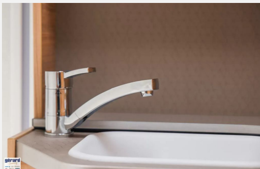
gérard Caravaning 08803 / 63 64-0 info@wohnen-gerard.de KNAUS WEINSBERG INTER CARAVANNING RENT OF TRAVEL FENDT CARAVAN