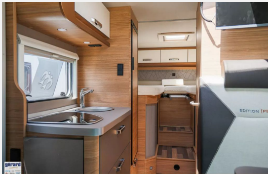
gérard Caravaning 08803 / 63 64-0 info@wohnwagen-gerard.de KNAUS WEINSBERG RENT-OF-TRAVEL FENDT CARAVAN INTER CARAVANNING