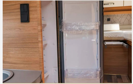
gérard Caravaning 08803 / 63 64-0 info@wohnen-gerard.de KNAUS WEINSBERG INTER CARAVANNING RENT OF TRAVEL FENDT CARAVAN