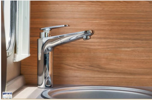
gérard Caravaning 08803 / 63 64-0 info@wohnen-gerard.de KNAUS WEINSBERG INTER CARAVANNING RENT OF TRAVEL FENDT CARAVAN