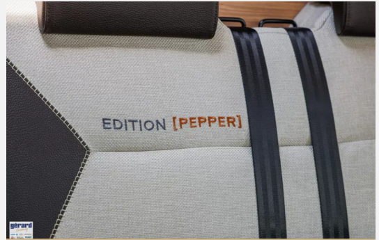
gérard Caravaning 08803 / 63 64-0 info@wohnwagen-gerard.de KNAUS WEINSBERG RENT-OF-TRAVEL FENDT CARAVAN INTER CARAVANNING