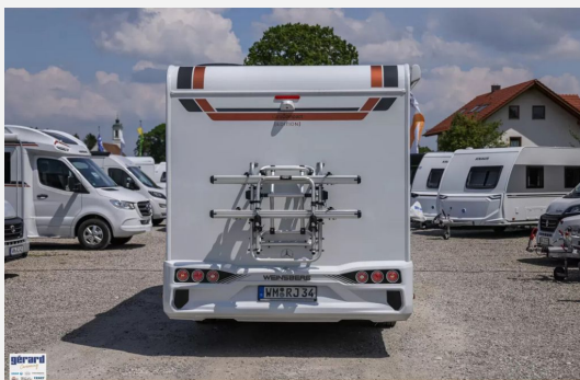
gérard Caravaning 08803 / 63 64-0 info@wohnwagen-gerard.de KNAUS WEINSBERG RENT OF TRAVEL FENDT CARAVAN INTER CARAVANNING