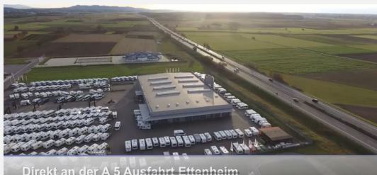
Direkt an der A 5 Ausfahrt Ettenheim