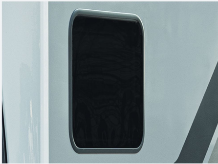
Rahmenfenster SEITZ S7P