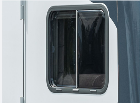
Schiebefenster auf Beifahrerseite (Höhe Sitzgruppe)