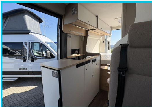
Seite 1987 von Bayer Seite SINGHOF