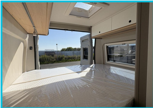
Seite 1987 von Bayer Seite SINGHOF