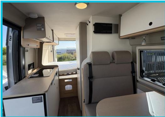
Seite 1987 von Bayer Seite SINGHOF