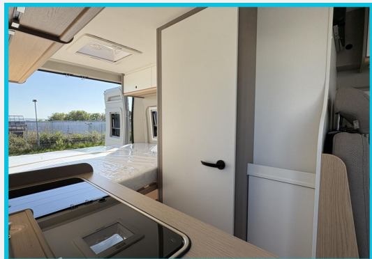
Seite 1987 von Bayer Seite SINGHOF