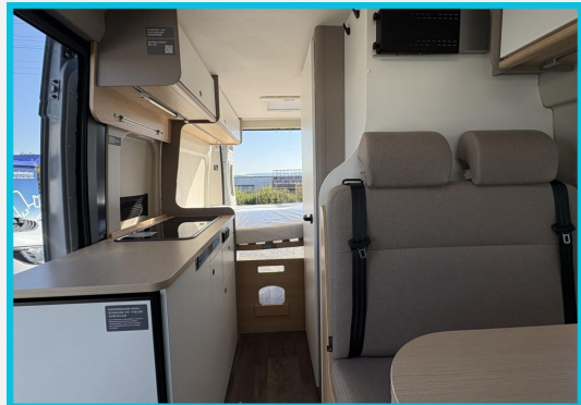
Seite 1987 von Bayer Seite SINGHOF