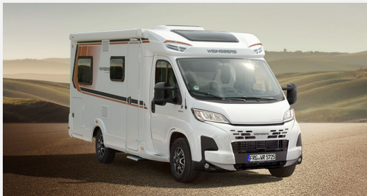
Aufbautür: WEINSBERG EXKLUSIV statt Komfort