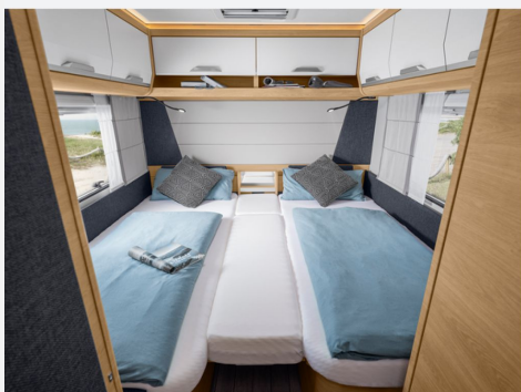
Rollbettfunktion für Einzelbetten