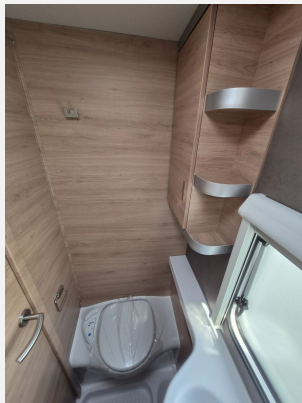
Duschausbau Standardwaschraum: Brausekopf ausziehbar, Halter für Brausekopf und Duschvorhang