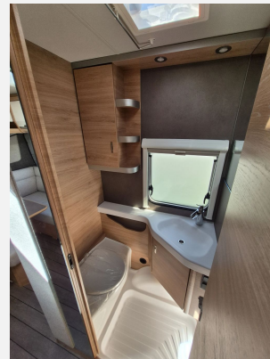
Duschausbau Standardwaschraum: Brausekopf ausziehbar, Halter für Brausekopf und Duschvorhang