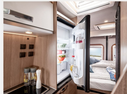
Kompressor-Kühlschrank 95 Liter, energieeffizient (incl. 12,8 Liter Gefrierfach)