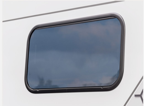
Rahmenfenster SEITZ S7P