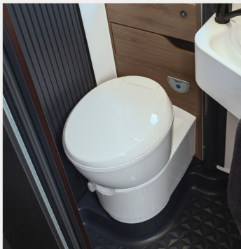
Kassetten-Toilette THETFORD drehbar