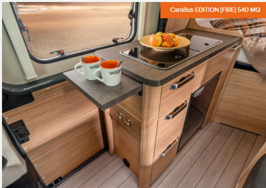
CaraBus EDITION [FIRE] 540 MQ