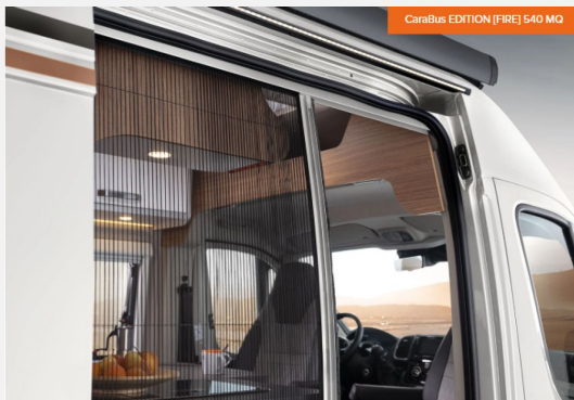
Regenrinne über der Schiebetür mit LED (dimmbar)