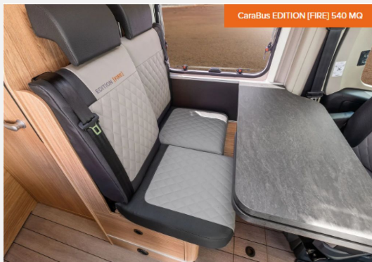
CaraBus EDITION [FIRE] 540 MQ