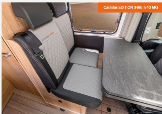
CaraBus EDITION [FIRE] 540 MQ