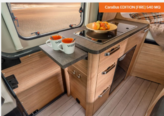
CaraBus EDITION [FIRE] 540 MQ