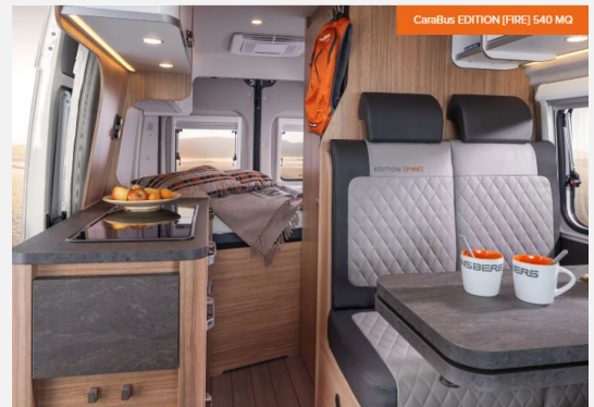
CaraBus EDITION [FIRE] 540 MQ