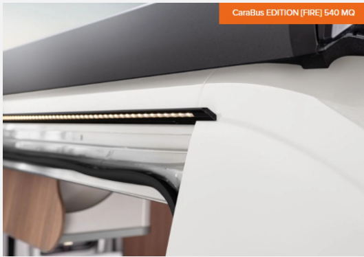
CaraBus EDITION [FIRE] 540 MQ