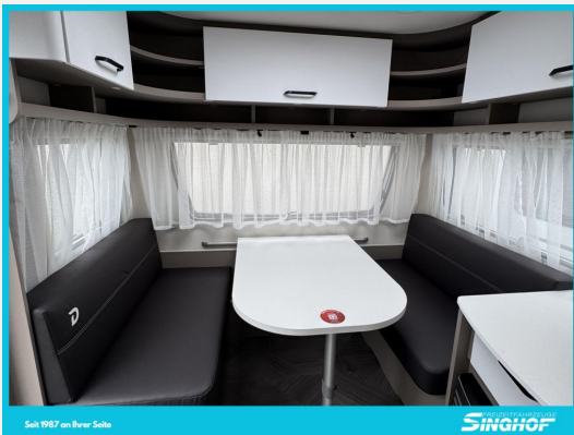
Seite 1987 von 1989 Seiten