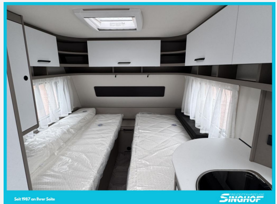
Seite 1987 von 1989 Seiten