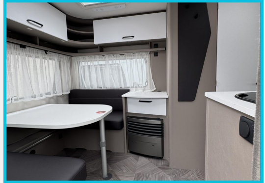
Seite 1987 von 1989 Seiten