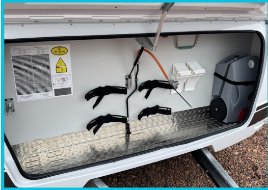
Seite 1987 von 1989 Seiten