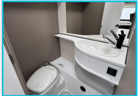
Seite 1987 von 1989 Seiten