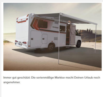
Immer gut geschützt: Die serienmäßige Markise macht Deinen Urlaub noch angenehmer.