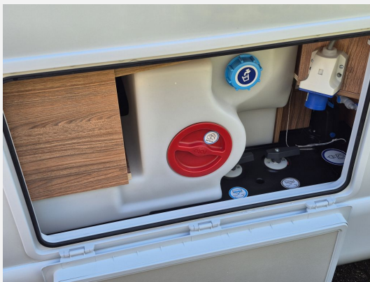
Rahmenfenster SEITZ S7P