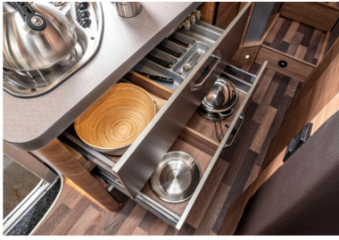
Hochwertiger kugelgeführter Auszug mit Soft-Close, mit Besteckensatz.