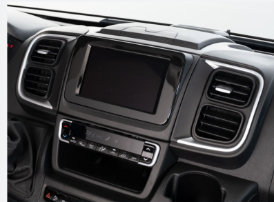
Instrumententafel im Techno-Design (Alu)

Das Armaturenbrett Techno zeichnet sich durch eine silberne Verkleidung der Lüftungsdüsen aus.