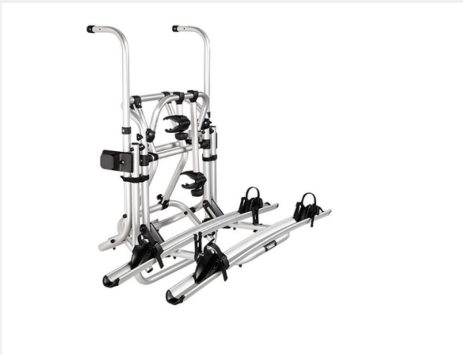
Fahrradträger für 2 Räder, Heck: THULE LIFT V16

Das Armaturenbrett Techno zeichnet sich durch eine silberne Verkleidung der Lüftungsdüsen aus.