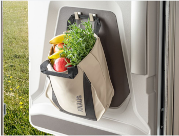
Multifunktionale Tasche im KNAUS Design