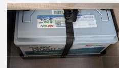
Neue Redodo LiFePo140 Ah 4 5 Tage autark stehen