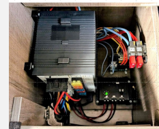
Neuer Schaudt EBL 271 Elektroblock-Einheit