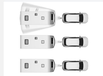
AL-KO Trailer Control-ATC – Anti-Schleuder-System (2.0)

Das Anti-Schleuder System von AL-KO • verhindert Schlingerbewegungen und gefährliche Aufschaukeln des Gespannes Das Bremsen erfolgt • sanft, aber für den Fahrer spürbar • erfolgt ohne Aufleuchten der Bremslichter